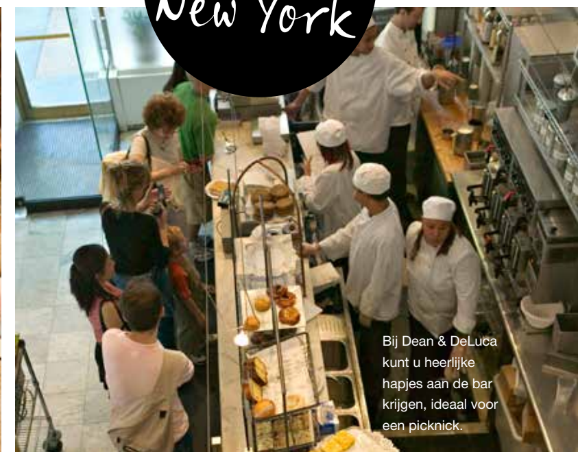
Bij Dean & DeLuca kunt u heerlijke hapjes aan de bar krijgen, ideaal voor een picknick.