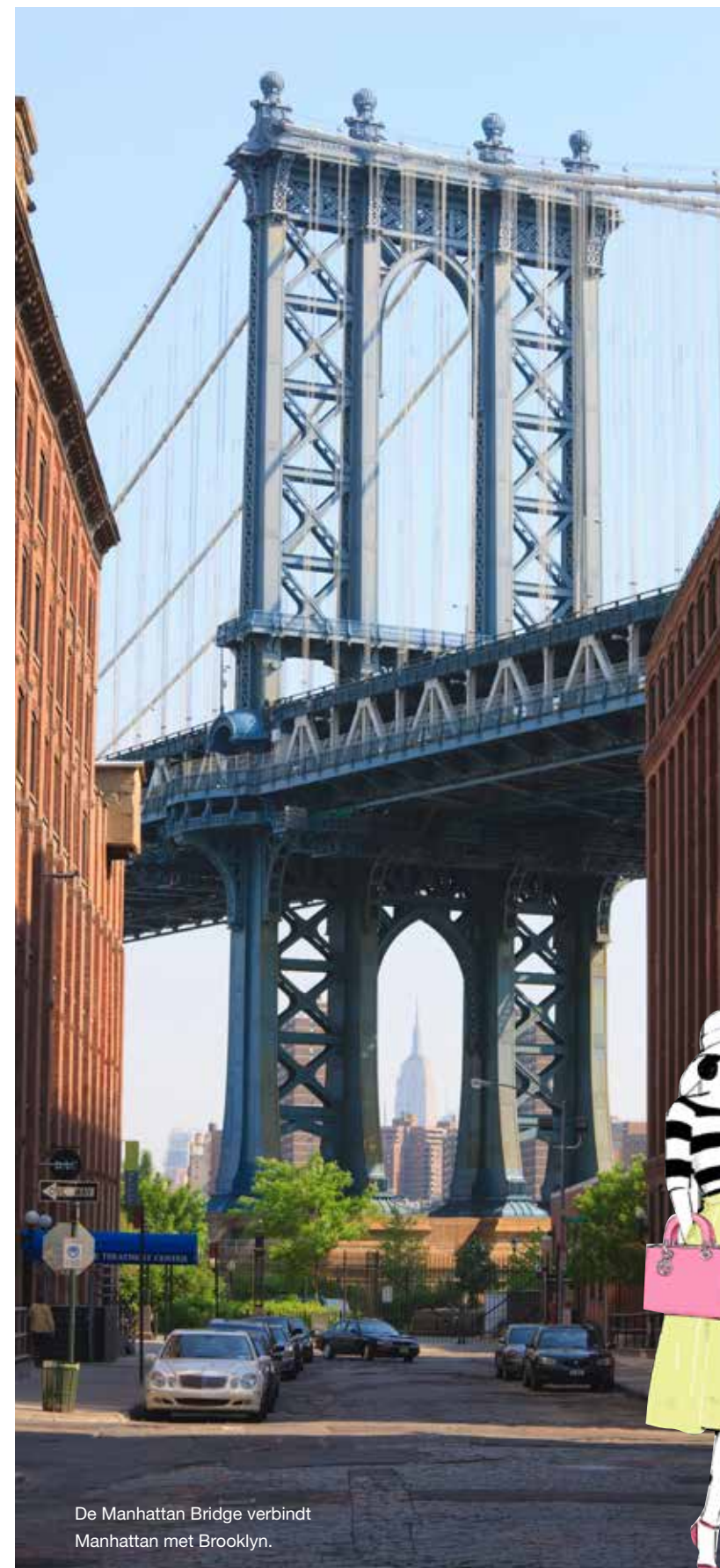
De Manhattan Bridge verbindt Manhattan met Brooklyn.

Wie tussen de beroemde wolkenkrabbers van de stad loopt, waant zich in een filmdecor. Mis vooral niet het bijzondere Flatiron Building, op de kruising van Broadway en Fifth Avenue. Het gebouw dankt zijn naam aan de bijzondere vorm: het is net een strijkijzer. Wandel langs het kunstzinnige Ace Hotel (20 West 29th Street) en ga zeker even kijken in de rijkgedecoreerde lobby van het Empire State Building. Ook op het terras van de nabijgelegen New York Public Library is het heerlijk mensen kijken. Of neem deel aan een gratis rondleiding door de historische bibliotheek ( www.nypl.org ). Frisse lucht kun je opsnuiven in de groene oase van Bryant Park, voordat je een kijkje neemt in de schitterende hal van het Grand Central Terminal stationsgebouw en in de art-decolobby van Chrysler Building, de mooiste wolkenkrabber van de stad. Leuk: bij Tommy Bahama (551 5th Avenue) kunt u aanschuiven voor een Hawaïaans-Amerikaans diner: heel veel exotische vis en als afsluiter bijvoorbeeld een stuk pina colada-cake. Het mooiste uitzicht over Manhattan? Dat is rond zonsondergang waar te nemen, op wolkenkrabber Rockefeller Center. Nog energie over? Wandel over Times Square en kijk naar de indrukwekkende reclames of woon een theatershow of musical bij op Broadway.